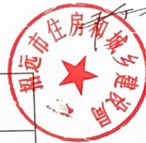
5. 住房和城乡建设局2022年度行政检查情况统计表