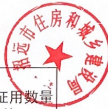
4. 住房和城乡建设局2022年度行政征收征用情况统计表