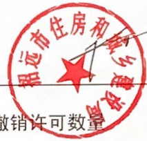
1. 住房和城乡建设局2022年度行政许可情况统计表